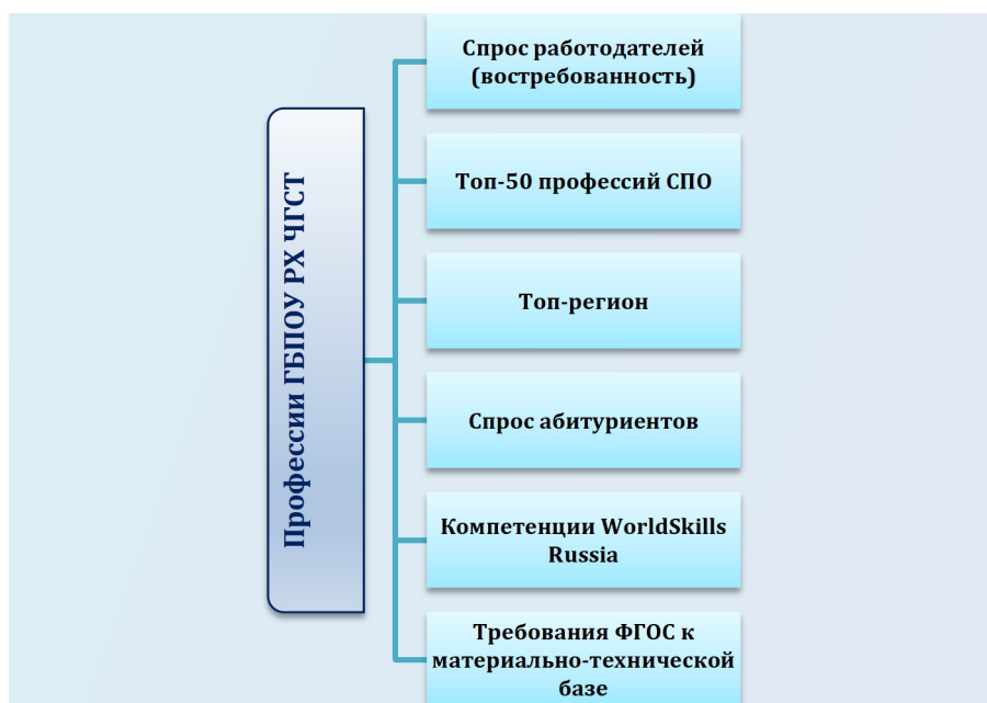
Рис 1. Направления мониторинга профессий и специальностей ГБПОУ РХ ЧГСТ