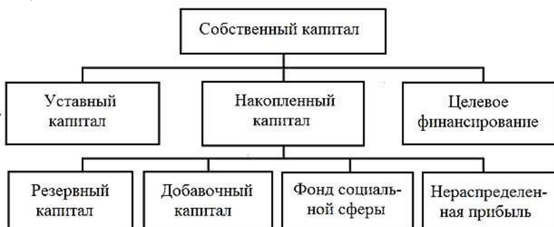
Рисунок 1 – Собственный капитал

Внутреннее финансирование предполагает использование собственных средств (рис.1).