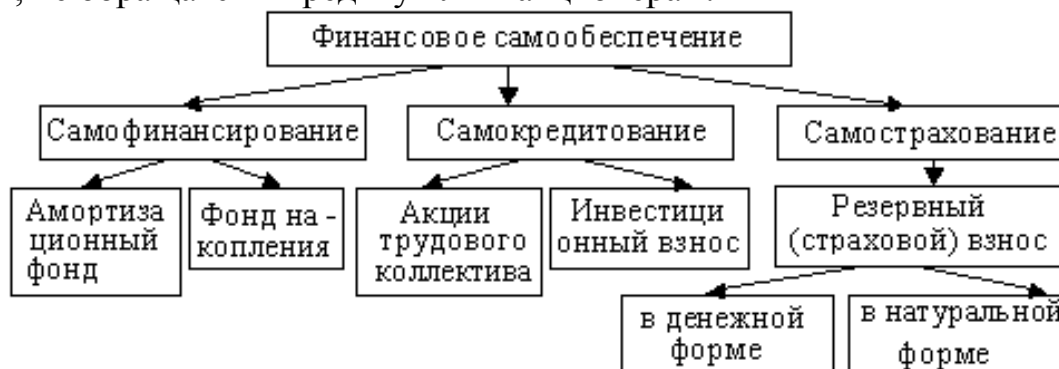
Рисунок 4 - Структурная схема финансового самообеспечения

денежные средства, которые хозяйствующий субъект может повторно инвестировать, не обращаясь к кредиту или к акционерам.