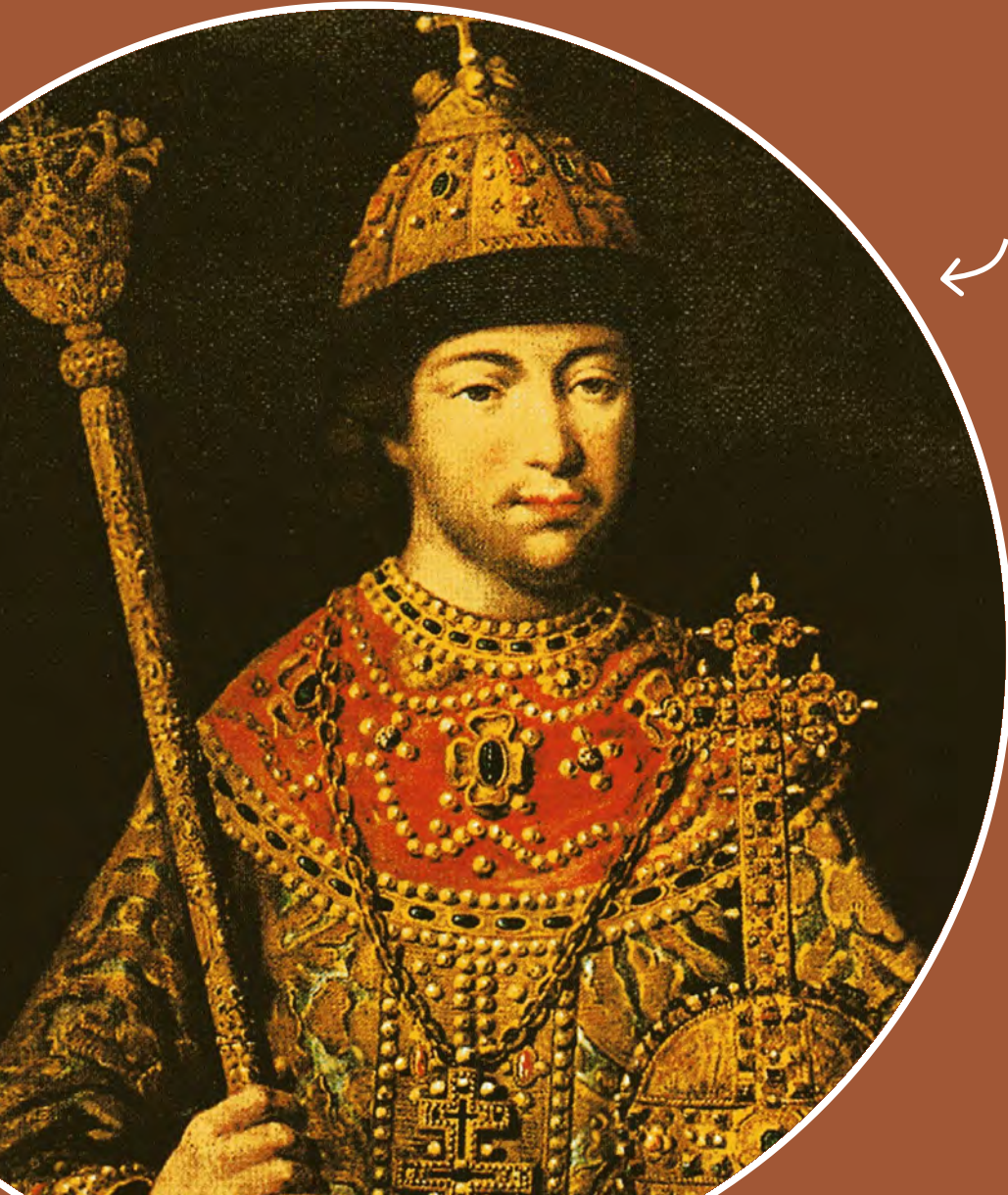
← Юный Михаил Фёдорович Романов