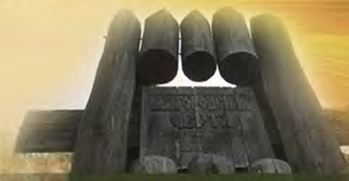
УКРЕПЛЕНИЕ ЮЖНЫХ РУБЕЖЕЙ