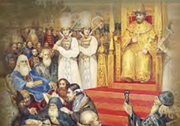
ЗЕМСКИЕ СОБОРЫ И ПРЕОДОЛЕНИЕ СМУТЫ