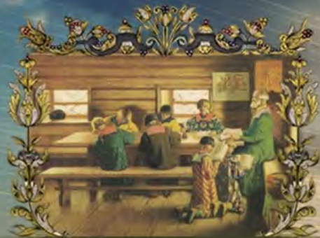
РАЗВИТИЕ ОБРАЗОВАНИЯ И ПЕРВЫЙ БУКВАРЬ