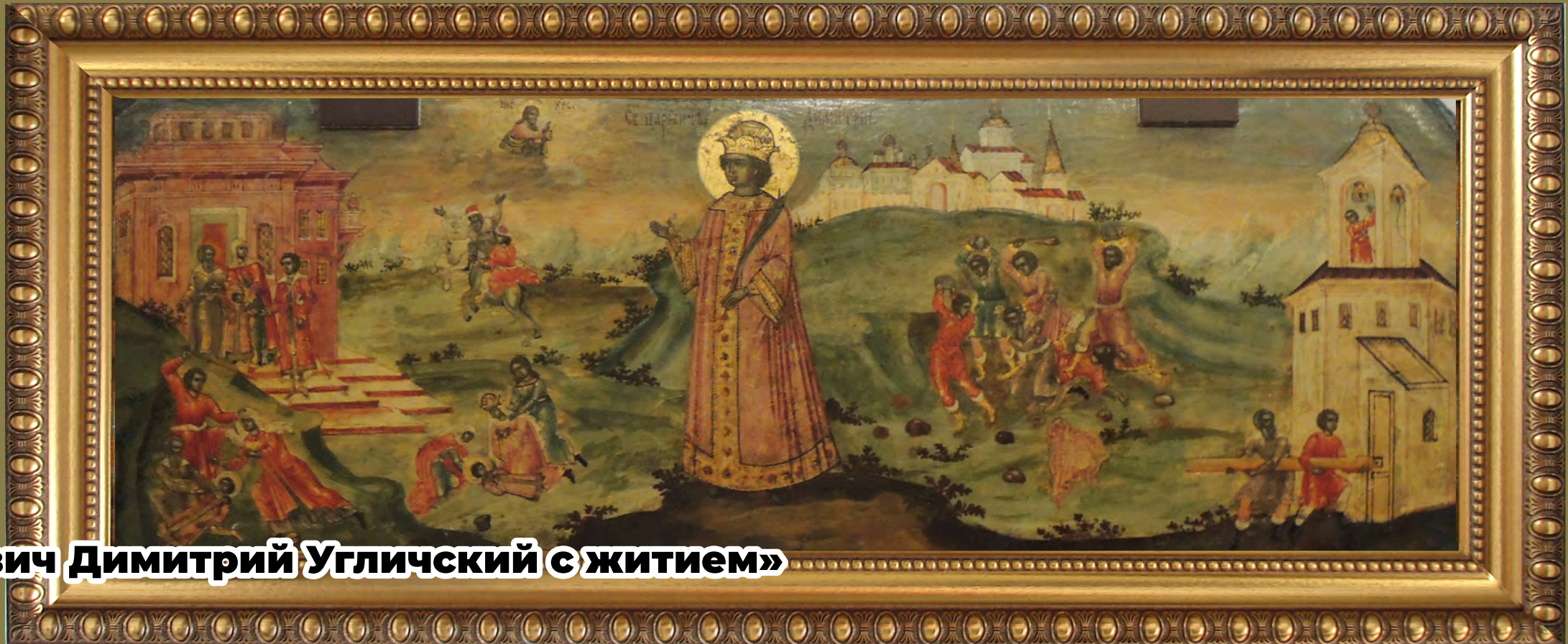
«Царевич Димитрий Угличский с житием»

В Российском царстве назревал династический кризис – царь был бездетен, а его младший брат 8-летний царевич Дмитрий погиб при загадочных обстоятельствах в Угличе в 1591 году.