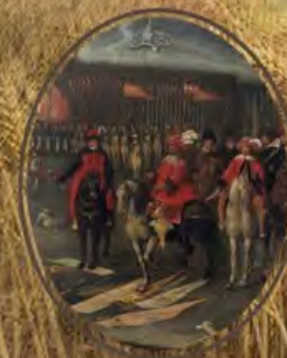
СМОЛЕНСКАЯ ВОЙНА 1632–1634