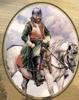
ПОЛКИ НОВОГО СТРОЯ