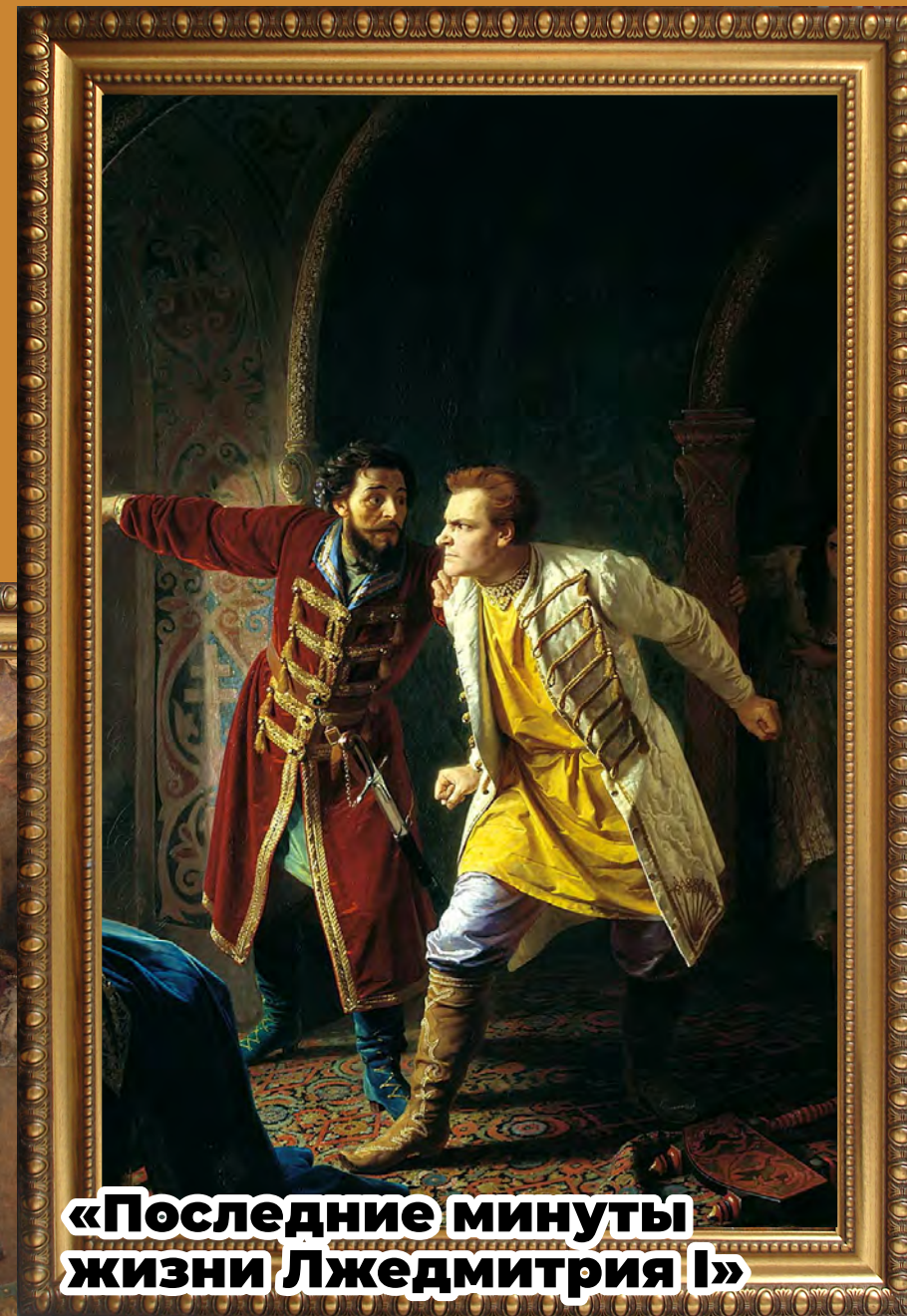
«Последние минуты жизни Лжедмитрия I»