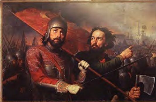
Дмитрий Пожарский и Кузьма Минин