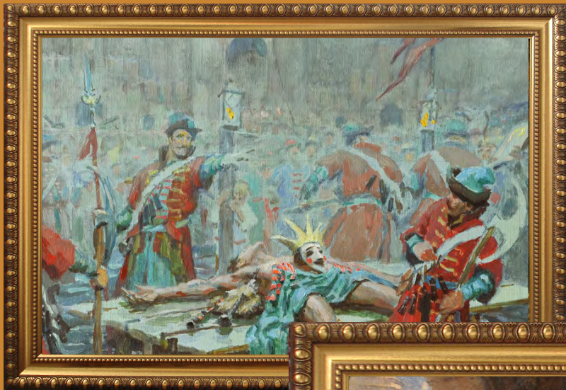
«Смутное время. Лжедмитрий»

Эскиз к картине, С. А. Кириллов, 2013 год