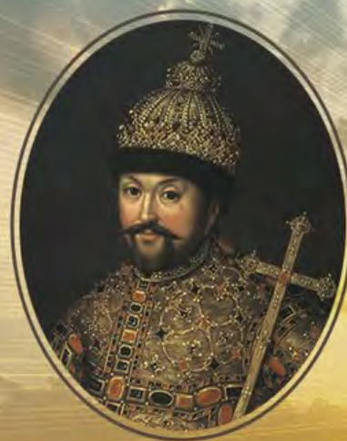
МИХАИЛ ФЕДОРОВИЧ ГОДЫ ЦАРСТВОВАНИЯ: 1613–1645