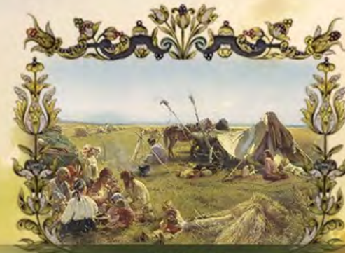
РОССИЯ – КОРМИЛИЦА ЕВРОПЫ