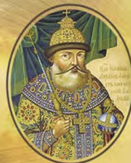
ЦАРЬ И ПАТРИАРХ