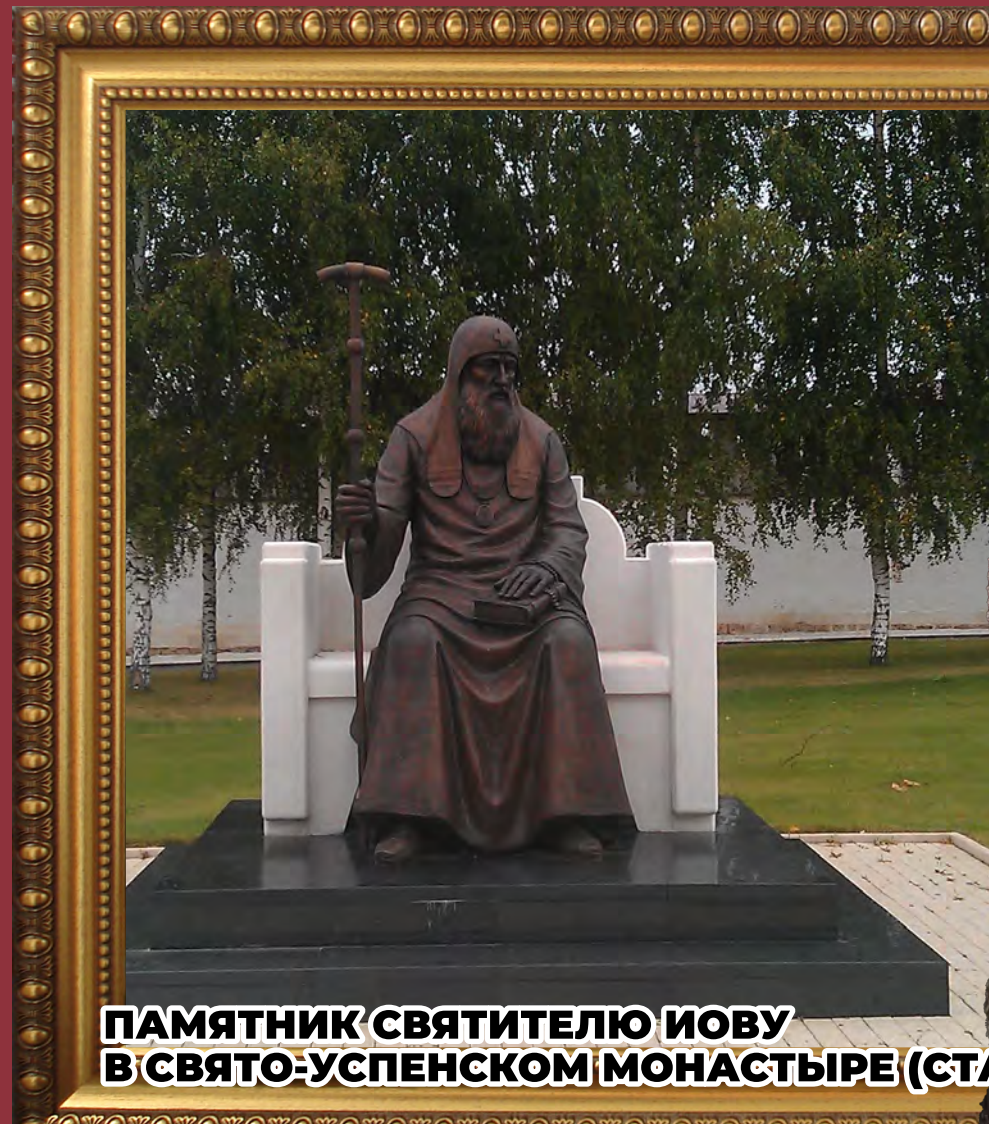
ПАМЯТНИК СВЯТИТЕЛЮ ИОВУ В СВЯТО-УСПЕНСКОМ МОНАСТЫРЕ (СТАРИЦА)