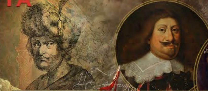
Сигизмунд III и Владислав IV