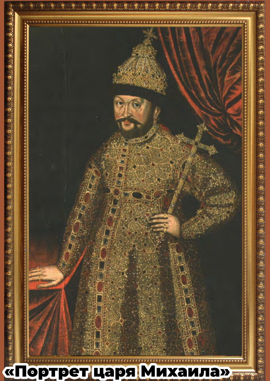
«Портрет царя Михаила»